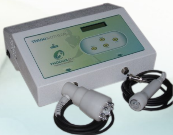
Imagen real del equipo